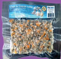
Sachet 300 g Taille standard réf : AR00071

Surgelées individuellement Utilisation : entière ou en chapelet