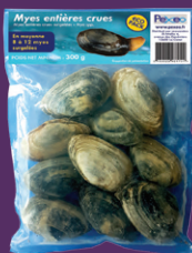
Sachet 300 g minimum réf : AR00171

Surgelées individuellement Utilisation : chair entière ou morceau ligaturé En moyenne 10 pièces