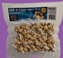
Sachet 300 g Taille XL réf : AR00254