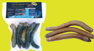
6 pièces réf : AR00051