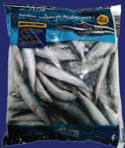
Sachet 1 kg réf : AR00030

Taille 45/65 pièces au kilo Surgelées individuellement Utilisation : entières - filets - tronçons