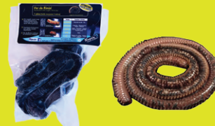
1 pièce réf : AR00045