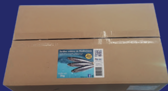
Carton 5 kg réf : AR00001