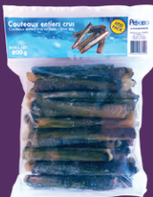
Sachet 800 g réf : AR00060

Surgelés individuellement Utilisation : entier élastiqué, chair ou morceau ligaturé En moyenne 40 pièces